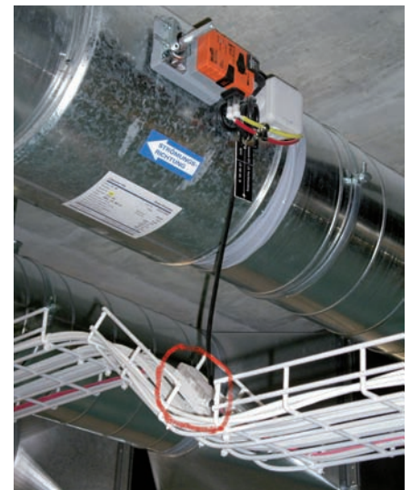
Erschliessung der Volumenstromregler mittels Woertz multibus Kabel

Die Realisation der HLK-GA verlief in allen Phasen ohne nennenswerte Probleme. Sie konnte innerhalb des budgetierten Kostenrahmens realisiert und termingerecht der Bauherrschaft übergeben werden.