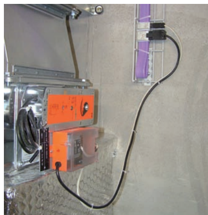
Anschluss der kommunikativen Brandschutzklappenantriebe mit Woertz Flachbandkabel 230V und LON-Bus in einem Kabel.

Als Herausforderung erwies sich der Anschluss des MP-BUS an die Controller des Steuerungssystems von Honeywell. Da dieses nicht auf offenen Programmierschnittstellen basiert und von aussen nur über einen LON-BUS adressierbar ist, mussten Gateways als Brücken vom MP- zum LON-BUS eingesetzt werden. Die Wahl fiel auf das Modell UK24-LON von Belimo.